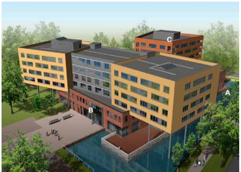
In het voorjaar van 2012 start de bouw van het dienstencentrum (A), met daarboven het nieuwe woonzorgcentrum Bloemswaard van HOZO (B) en de huurappartementen van woonstichting Stek (C). (Impressie: Grunstra Architecten Groep)

HOZO verzorgt de nieuwbouw van het nieuwe woonzorgcentrum Bloemswaard en Stek bouwt het dienstencentrum en de appartementen. De gemeente Hillegom verzorgt het bouw- en woonrijp maken van het terrein. De eerste werkzaamheden starten in januari 2012.