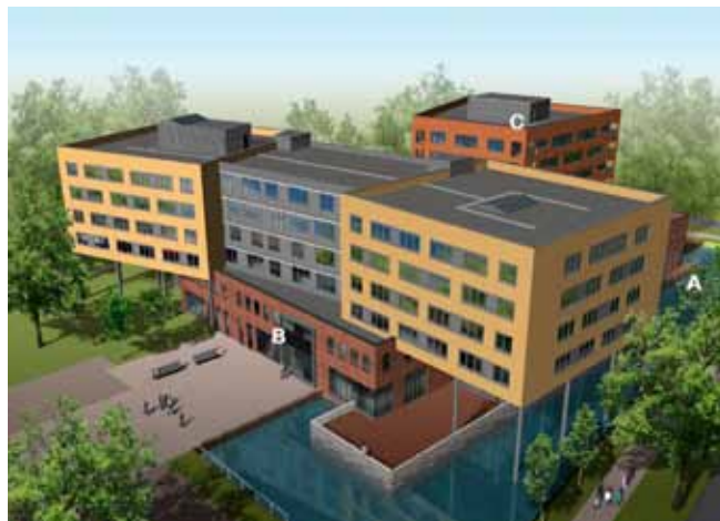
De entree van het dienstencentrum komt aan de zijde van het Palet en de Abellalaan.

Net geen 80% dus, maar dat was voor de Raad van