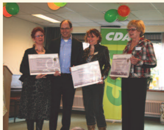
Overhandiging Zilveren Keurmerk door demissionair minister Ab Klink

Klachten: Er zijn bij de vertrouwenspersonen geen klachten binnen gekomen. De externe klachtencommissie van Avant heeft in 2010 een uitspraak gedaan over een in 2009 ingediende klacht.