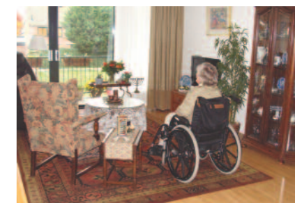
Driekamerappartement in Maronia

In Bloemswaard en Maronia samen werken 158 medewerkers (76,6 BFT) en 74 vrijwilligers.