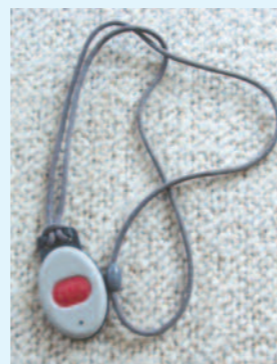
Hulp bij alarmering geeft een veilig gevoel

Een abonnement op dit alarmeringspakket kost €12,75. Hiervan wordt door Stek de apparatuur geleverd en wordt het onderhoud aan de apparatuur door hen gedaan. HOZO verzorgt de alarmopvolging. In 2010 namen 262 cliënten een abonnement op de alarmering bij HOZO af.