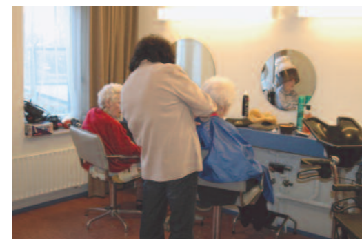
Bezoek aan de kapper in Parkwijk

In 2010 hadden 166 externe cliënten een abonnement op dit activiteitenpakket.